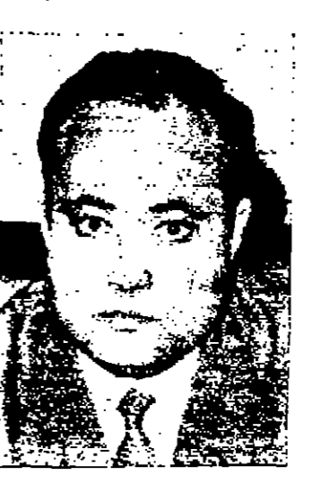
الكوتش الى المغرب اليوم بحث قضايا التفاوت بين البلدين

الرباط - رويتر - ذكر مسؤولون هنا ان السيد عبد الحميد الكوتش وزير ليبيا الغد ان يصل الى الرباط اليوم في زيارة رسمية تستغرق اربعة ايام سيبحث بمعية رئيسية مع الزعماء المغربيين في التعاون بين البلدين . ولكن هؤلاء المسؤولين قالوا ان من اول امور المسئلة التي ستناقشها الكوتش في الشرق الاوسط وسيبحث هذه الاتفاقات اقتصاديا وبالتعاون بين هذه البلدان وهي المغرب والجزائر وتونس وليبيا .